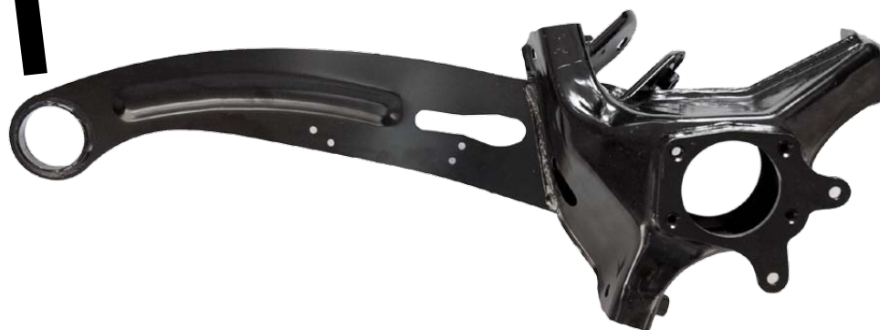
Podélné rameno Ref. Č. 1 202 268 a 1 202 267